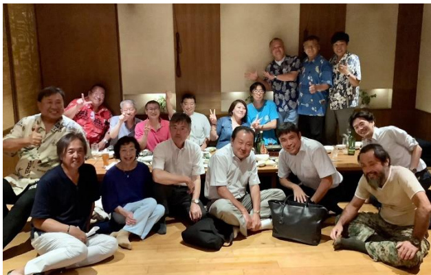
8/17 なんと牧場で開催された会員増強・維持委員会