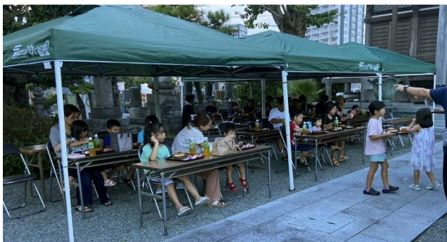
8/19 に開催された信隆寺子ども食堂