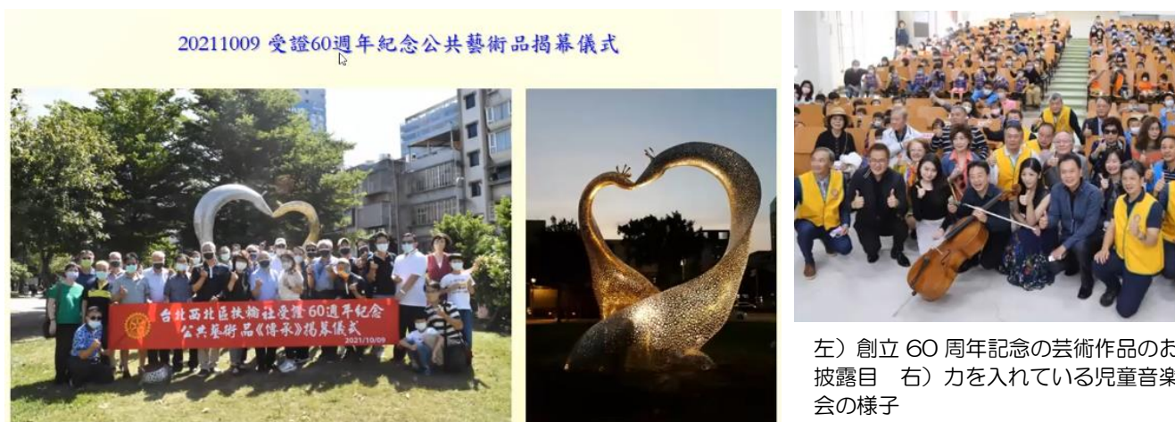
左) 創立 60 周年記念の芸術作品のお披露目 右) 力を入れている児童音楽会の様子