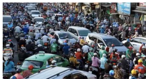
左) ベトナム生活を語るカーニー 中) 恋人と寄り添う写真。今後は結婚を視野に入れているとのこと 右) ベトナムの渋滞風景