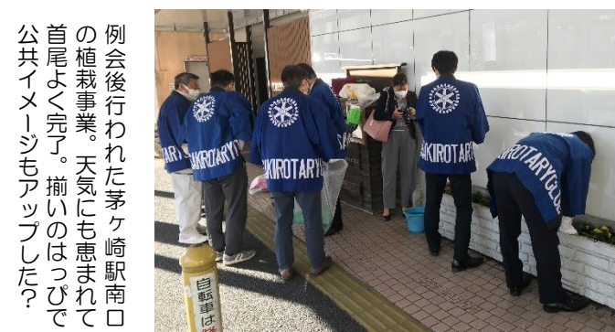
例会後行われた茅ヶ崎駅南口の植栽事業。天気にも恵まれて首尾よく完了。揃いのはついで公共イメージもアップした？