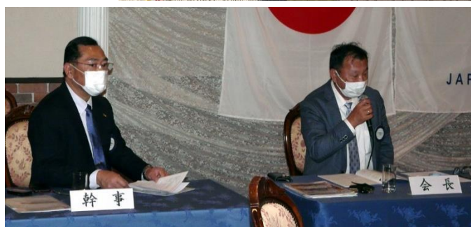
例会後のクラブ協議会。各委員会からの半期報告→