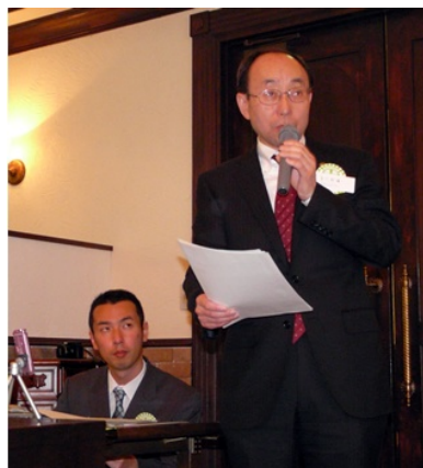
生川幹雄様 (茅ヶ崎市消防長)