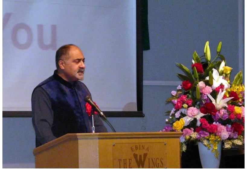
左)「子供達にポリオのない世界を」というテーマから発案した池亀武士ガバナー補佐 中)佐野英之ガバナー 右) 駐日パキスタン大使のファルク・アミール氏