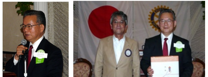
卓話「ロータリーにおける職業奉仕」