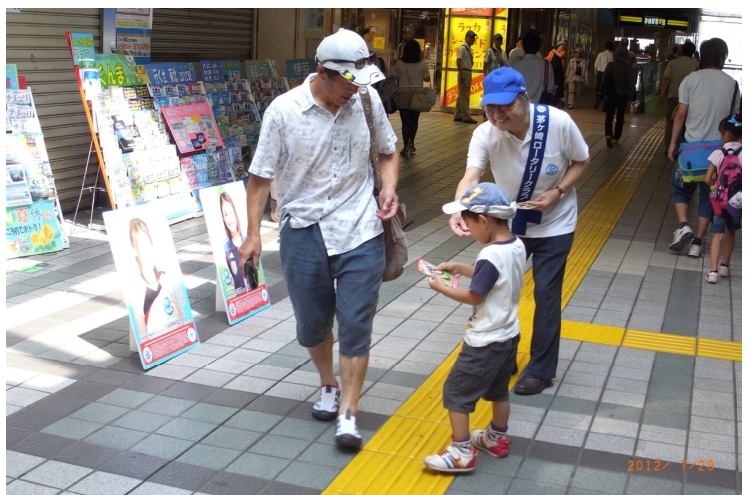
7/29（日）に実施された麻薬撲滅運動