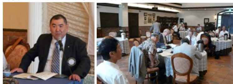
現年度最終クラブ協議会風景