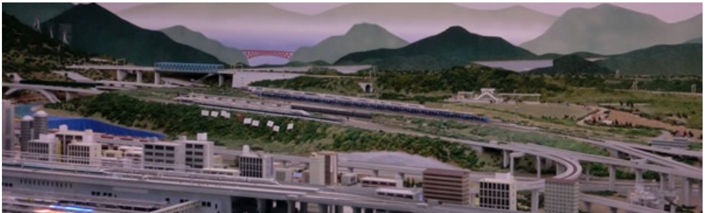
鉄道博物館にはジオラマや実物表示、またスクリーン解説・体験スペースもあり、鉄男・鉄子にはたまらない1日となりました