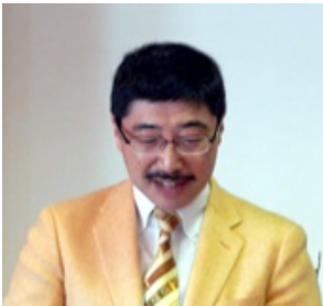
出席報告の湘南RC・小笹会員と当クラブ熊澤会員