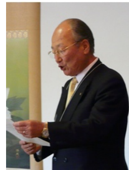
スマイル報告の古性会員と乾杯発声の湘南RC浅田会員