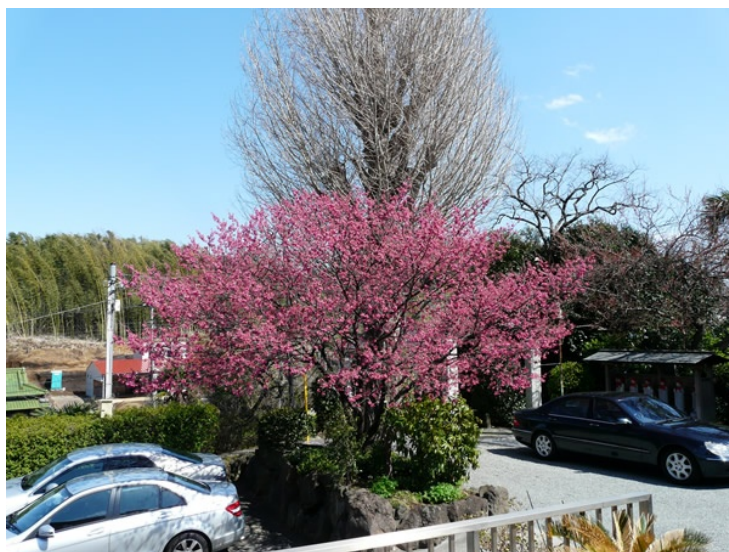
前日までの嵐が去り、花見例会に相応しい天気となりました